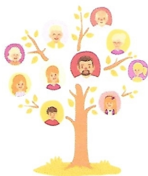
A árvore da família atual

Este assunto despertou a curiosidade das crianças e, portanto, ampliamos o tempo de discussões mais um mês. As receitas foram saboreadas por todas as crianças.