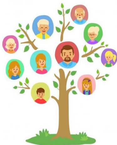
A árvore da família atual

Este assunto despertou a curiosidade das crianças e, portanto, ampliamos o tempo de discussões por mais um mês.